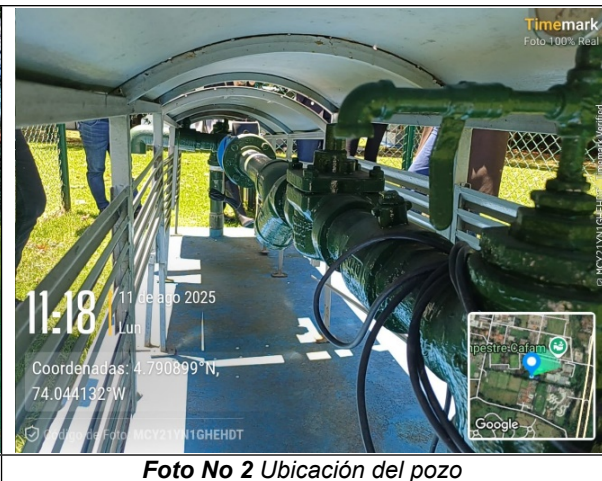
Foto No 2 Ubicación del pozo

La boca del pozo se encuentra sobre una estructura cementada y está protegida con una tapa metálica. Según la información suministrada por el usuario, el punto de agua no se utiliza para captación desde el 24 de febrero del presente año; no obstante, cuenta con dispositivo de medición de caudal (medidor marca Controlagua, serial 21072142), con lectura acumulada de 65.228 m 3 (Foto No. 3).