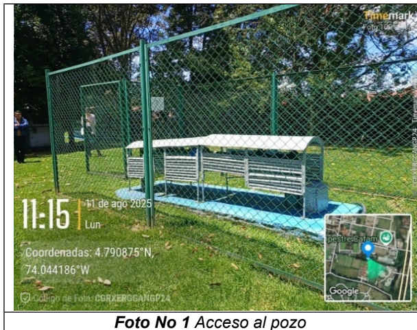
Foto No 1 Acceso al pozo

El 11 de agosto del 2025 se realizó visita de control en la Calle 215 No. 45 – 45 con el fin de verificar el estado actual del pozo identificado ante la Entidad con código pz-11-0080 (Cafam No 2), el cual se localiza en cercanías a la planta de tratamiento (ver Foto No. 1 y 2).